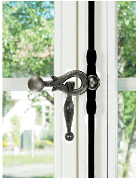
Poignée acier huilé avec bouton plat fonte huilée garniture vernie noire