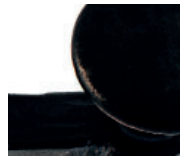
acier verni noire