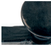
acier verni noire antique