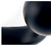
zinc moulé verni noir