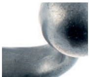
zinc moulé brut