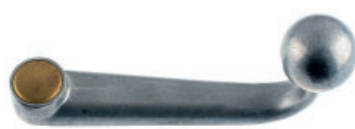
Poignée forme col de cygne zinc moulé brut