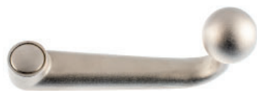
Poignée forme col de cygne zinc moulé nickelé mat