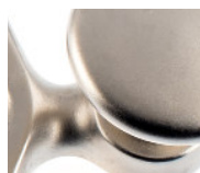
fonte nickelée mat