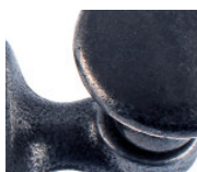
fonte vernie noire antique