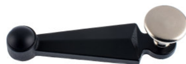
Poignée fonte vernie noire bouton plat laiton nickelé mat