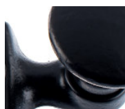
fonte vernée noire