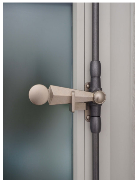
Poignée fonte et bouton plat laiton nickelés mat garniture vernie noire antique