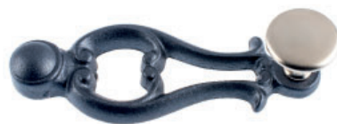
Poignée fonte vernie noire antique bouton plat laiton nickelé mat