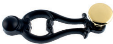
Poignée fonte vernie noire bouton plat laiton poli