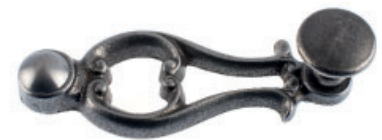
Poignée avec bouton plat fonte brute