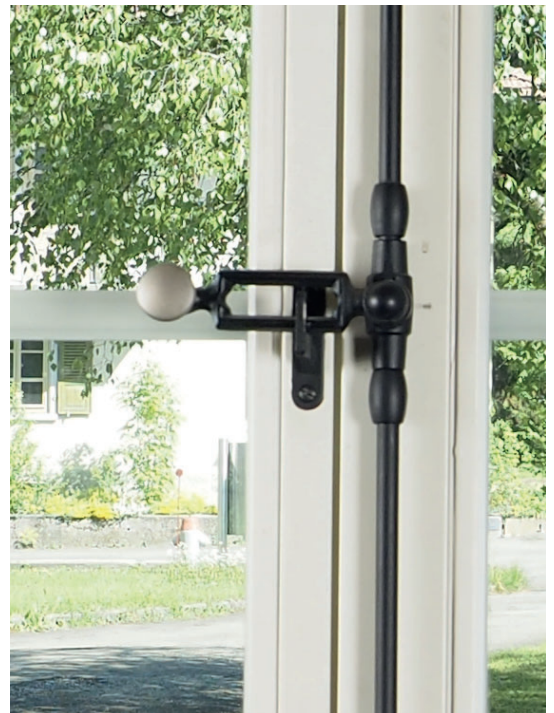
Poignée fonte vernise noire avec bouton plat laiton nickelé mat