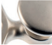
laiton nickelé mat