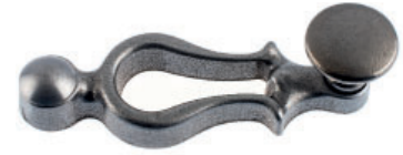
Poignée avec bouton plat fonte brute