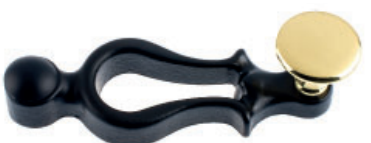
Poignée fonte vernie noire bouton plat laiton poli