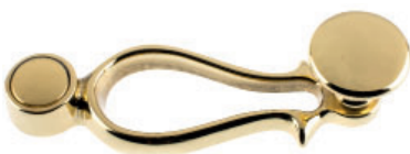
Poignée avec bouton plat laiton poli