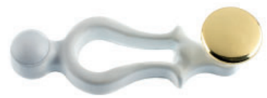
Poignée fonte vernie blanche bouton plat laiton poli