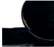
Stahl schwarz lackiert