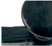
Stahl Patina gussgrau