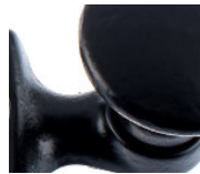
Guss schwarz lackiert