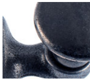
Guss altblank lackiert