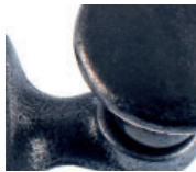
Guss altblank lackiert