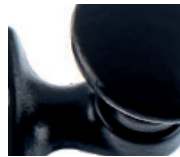
Guss schwarz lackiert