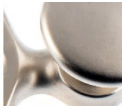
Messing vernickelt matt