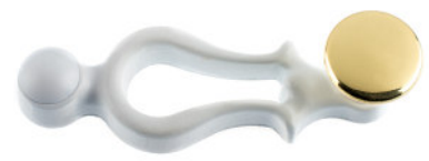
Ruder Guss weiss lackiert Flachknopf Messing poliert