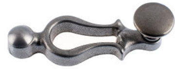
Ruder mit Flachknopf Guss roh