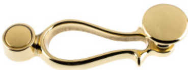
Ruder mit Flachknopf Messing poliert