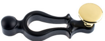
Ruder Guss schwarz lackiert Flachknopf Messing poliert