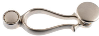
Ruder mit Flachknopf Messing vernickelt matt