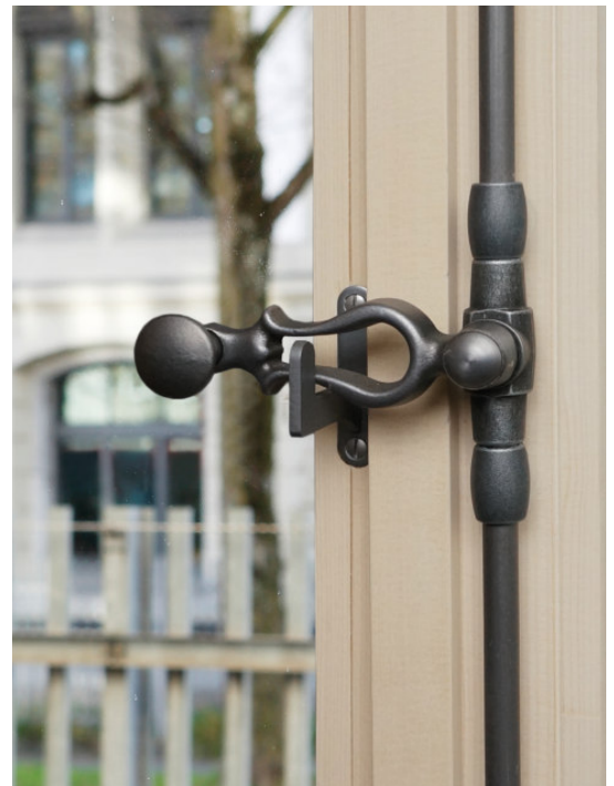
Ruder Guss roh mit Flachknopf Patina gussgrau