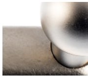
Guss vernickelt matt