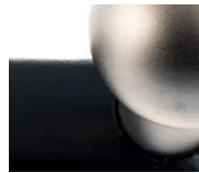
Guss schwarz lackiert