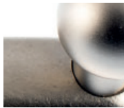
Guss vernickelt matt