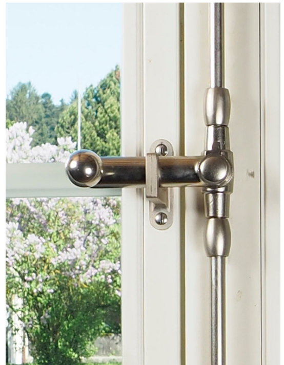
Ruder Guss mit Kugelknopf Messing vernickelt matt