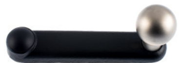
Ruder Guss schwarz lackiert Kugelknopf vernickelt matt