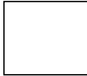
Zinkdruckguss NCS/RAL lackiert