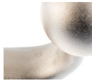
Zinkdruckguss vernickelt matt