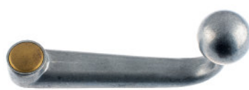
Schwanenhalsruder Zinkdruckguss roh