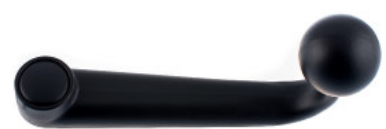
Schwanenhalsruder Zinkdruckguss schwarz lackiert