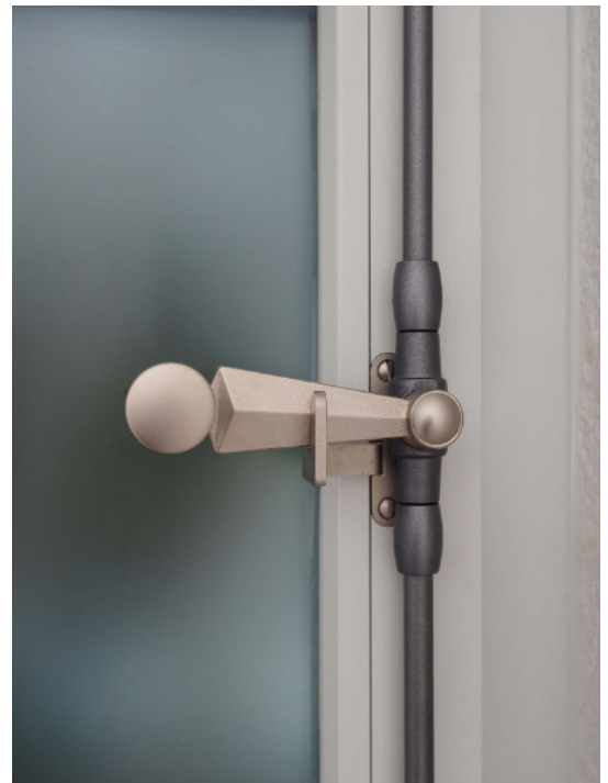
Ruder Guss mit Flachknopf Messing vernickelt matt / Garnitur altblank lackiert