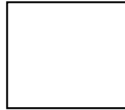
Guss NCS/RAL lackiert