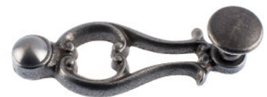
Ruder mit Flachknopf Guss roh