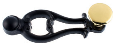
Ruder Guss schwarz lackiert Flachknopf Messing poliert