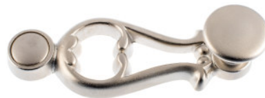
Ruder mit Flachknopf Messing vernickelt matt