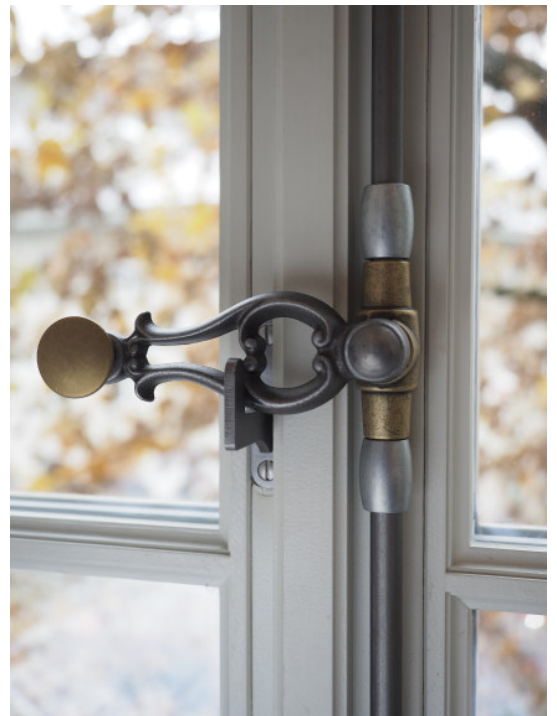
Ruder Guss roh mit Flachknopf Messing roh