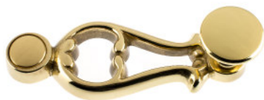
Ruder mit Flachknopf Messing poliert