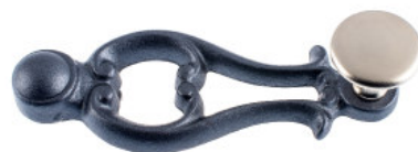
Ruder Guss altblank lackiert Flachknopf Messing vernickelt matt